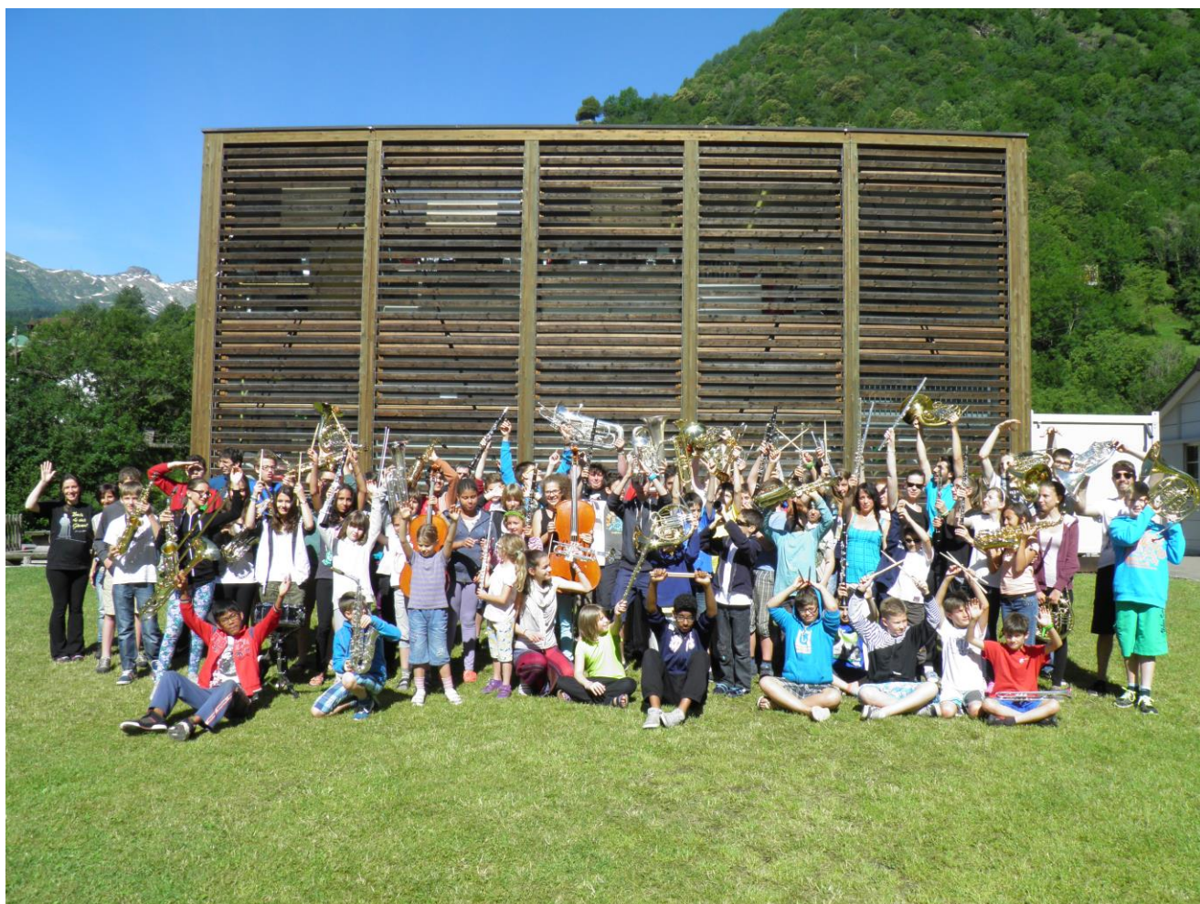
Corso "Musica, scienza e sport" 2015